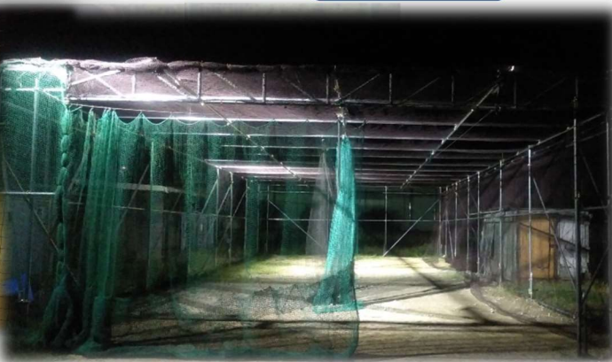
屋外バッティングゲージ