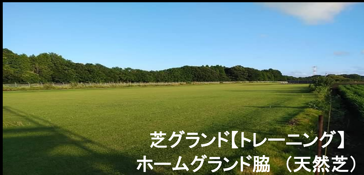
芝グラウンド【トレーニング】 ホームグラウンド脇（天然芝）