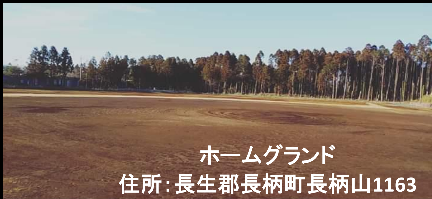
ホームグラウンド 住所：長生郡長柄町長柄山1163