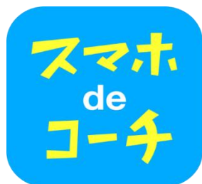
「スマホdeコーチ」アイコン