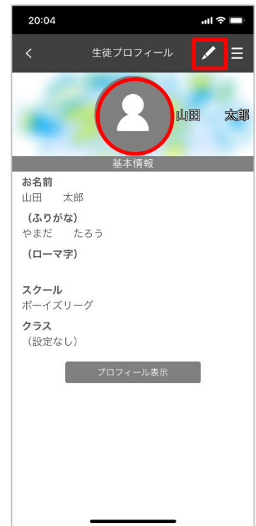
受講者プロフィール編集画面

受講者画像編集画面の「ファイルを選択」を押下し、画像を選択後、中心位置を設定し「アップロード」ボタンを押下します。